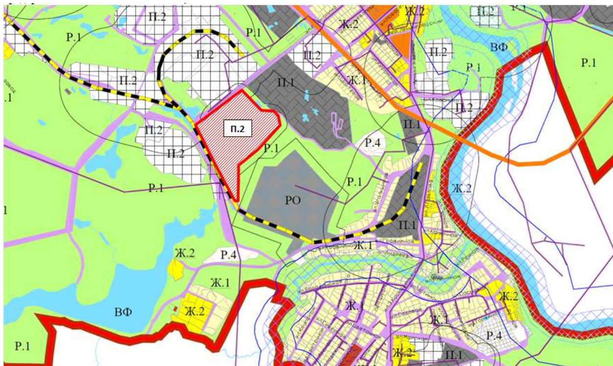
СХЕМА ВНЕСЕНИЯ ИЗМЕНЕНИЙ В ПРАВИЛА ЗЕМЛЕПОЛЬЗОВАНИЯ И ЗАСТРОЙКИ БОРОВИЧСКОГО ГОРОДСКОГО ПОСЕЛЕНИЯ